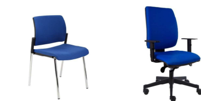
Ž1 - židle jednací (potah pouze ilustrační) Ž2 - židle pracovní (potah pouze ilustrační)

POTAHOVÁ LÁTKA Ž1, Ž2 - koženka barevné varianty