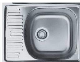
DŘEZ S MALÝM ODKAPÁVAČEM